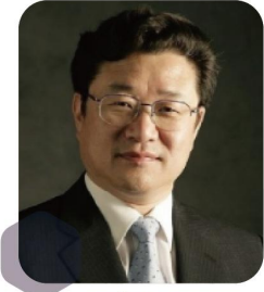
김준규 제37대 검찰총장