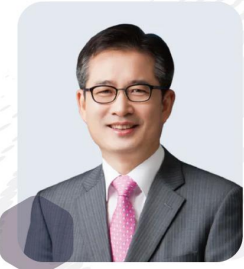
이건리 전 검사장