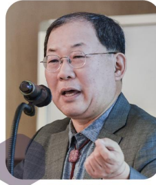
박병원 전 한국경영자총협회 회장