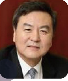
신제운 제4대 금융위원장