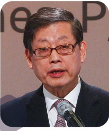
김황식 제41대 국무총리