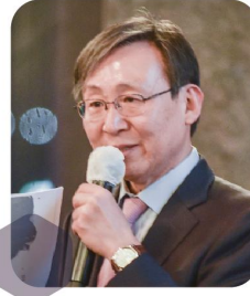
문재도 전 산업통상자원부 차관