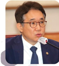
박선호 전 국토교통부 차관