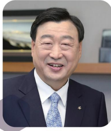
이희범 전 산업통상자원부 장관