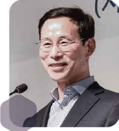
최정호 전 국토교통부 차관