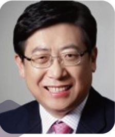
박재식 전 저축은행중앙회 회장