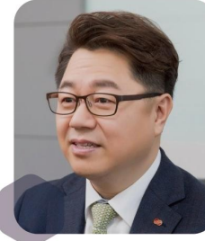
박일준 전 산업통상자원부 차관