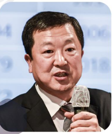
박춘섭 전 대통령실 경제수석