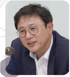
이정섭 전 환경부 차관