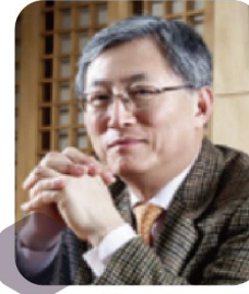
최중경 전 지식경제부 장관