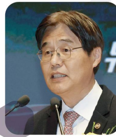
김형렬 전 행정중심복합도시 건설청장