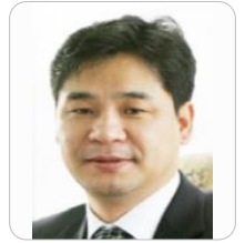
조달청 신기술서비스 국장