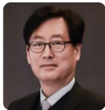
김경학 방위사업청 과장