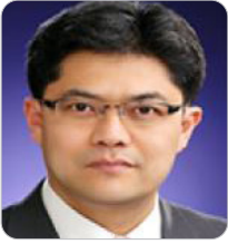
김언성 기획재정부 국장