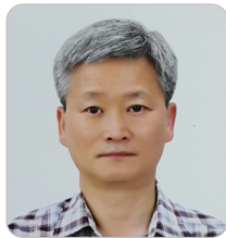
김성균 국립기상과학원 원장