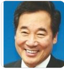
이낙연 국회의원 (前 국무총리)