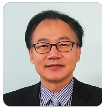
최규종 산업통상자원부 정책관