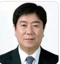
김대기 前 대통령실 정책실장