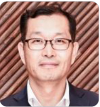
강완구 경제부총리 비서실장