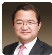
최재유 前 미래창조과학부 제2차관