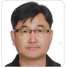
김용호 헌법재판소 기획조정실장