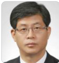
김재홍 前 KOTRA 사장