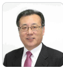
한정화 前 중소기업청 청장