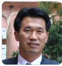
정재은 서울지방조달청 청장