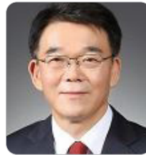
강호인 前 국토교통부 장관