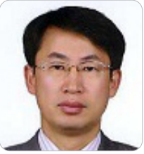
김성준 국방부 인사복지실장