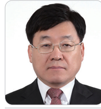
정만기 前 산업통상자원부 제1차관