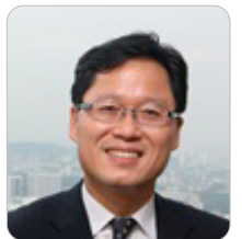
김창규 주 오만 대사