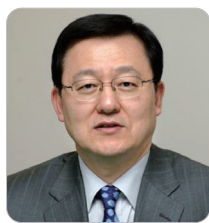
홍석우 前 지식경제부 장관