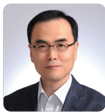
최정욱 前 인천지방국제청 청장