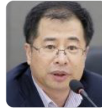
강경성 산업통상자원부 산업정책실장