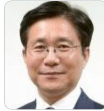
성윤모 前 산업통상자원부 장관