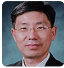
이창한 前 미래창조과학부 실장