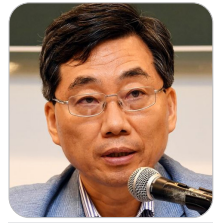
장신철 중앙노동위원회 상임위원