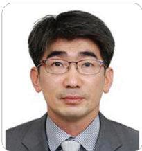
김문환 부산지방중소벤처기업청 청장