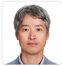
조영신 울산경제자유구역청 청장