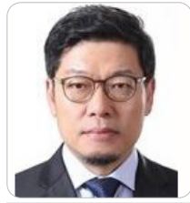
이정동 대통령 비서실 경제과학특별보좌관