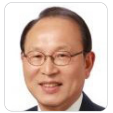
최운열 前 국회의원