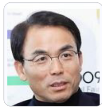
진대제 前 정보통신부 장관