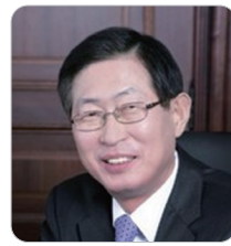
조환익 前 한국전력공사 사장