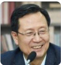
김종갑 前 한국전력공사 사장