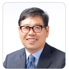
하대성 경상북도 경제부지사