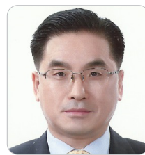
최태현 前 산업통상자원부 실장