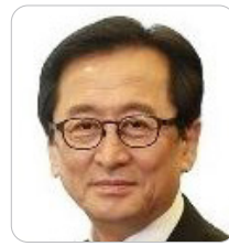
최수현 前 금융감독원 원장