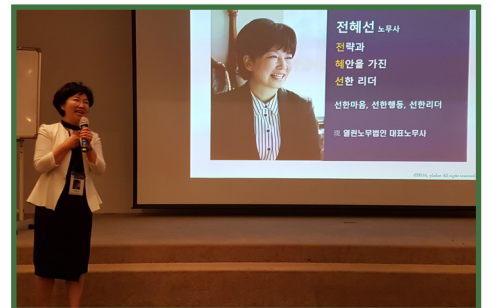
* 마이스토리를 발표중인 원우