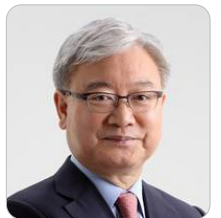
김석동 前 금융위원회 위원장