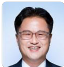
김정우 조달청 청장