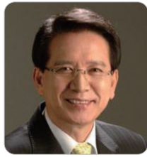
김형오 제18대 국회의장