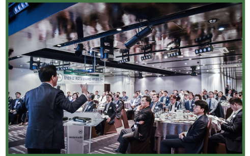
* 강의에 집중하는 원우들의 모습