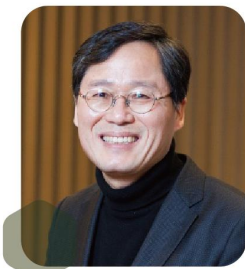
김창규 전 오만대사