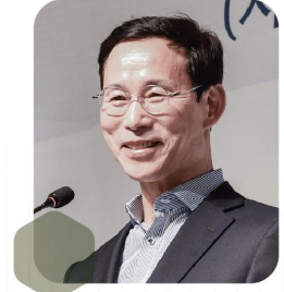
최정호 전 국토교통부차관