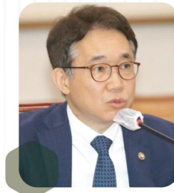
박선호 전 국토교통부차관