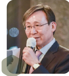
문재도 전 산업통상자원부차관