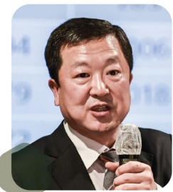
박춘섭 전 대통령실경제수석