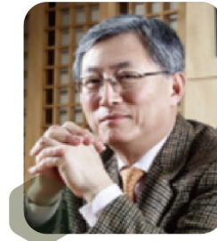
최중경 전 지식경제부장관