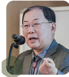
박병원 전 한국경영자총협회회장