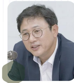
이정섭 전 환경부차관