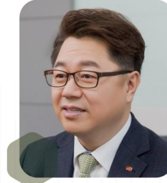
박일준 전 산업통상자원부차관