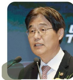
김형렬 전 행정중심복합도시 건설청장