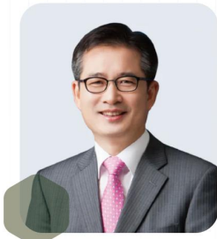
이건리 전 검사장