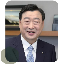
이희범 전 산업통상자원부장관