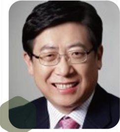
박재식 전 저축은행중앙회 회장