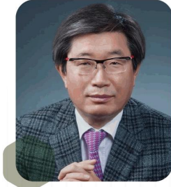
성용락 전 감사원사무총장